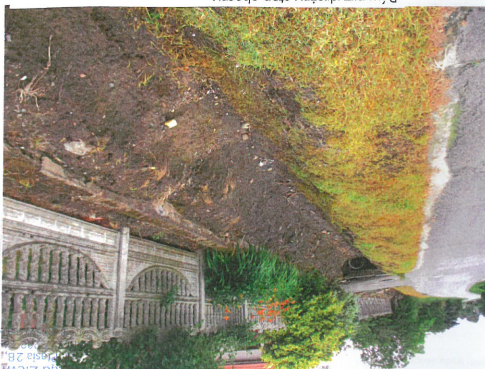
Rów przydrożny stan obecny Wjazd do posesji nr 108 – początek planowanej zabudowy