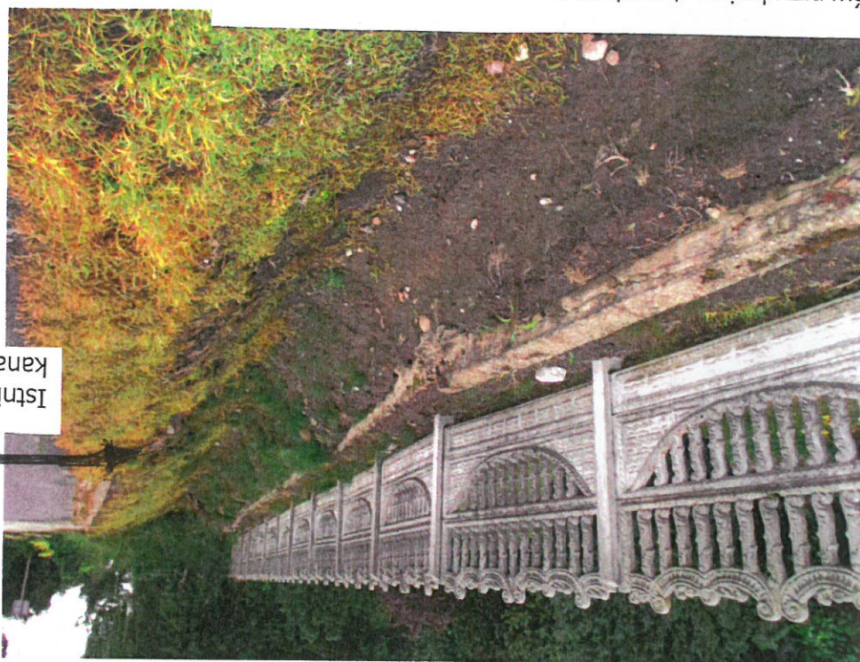
Istniejący wylot \Phi 40\text{cm} kanalizacji deszczowej