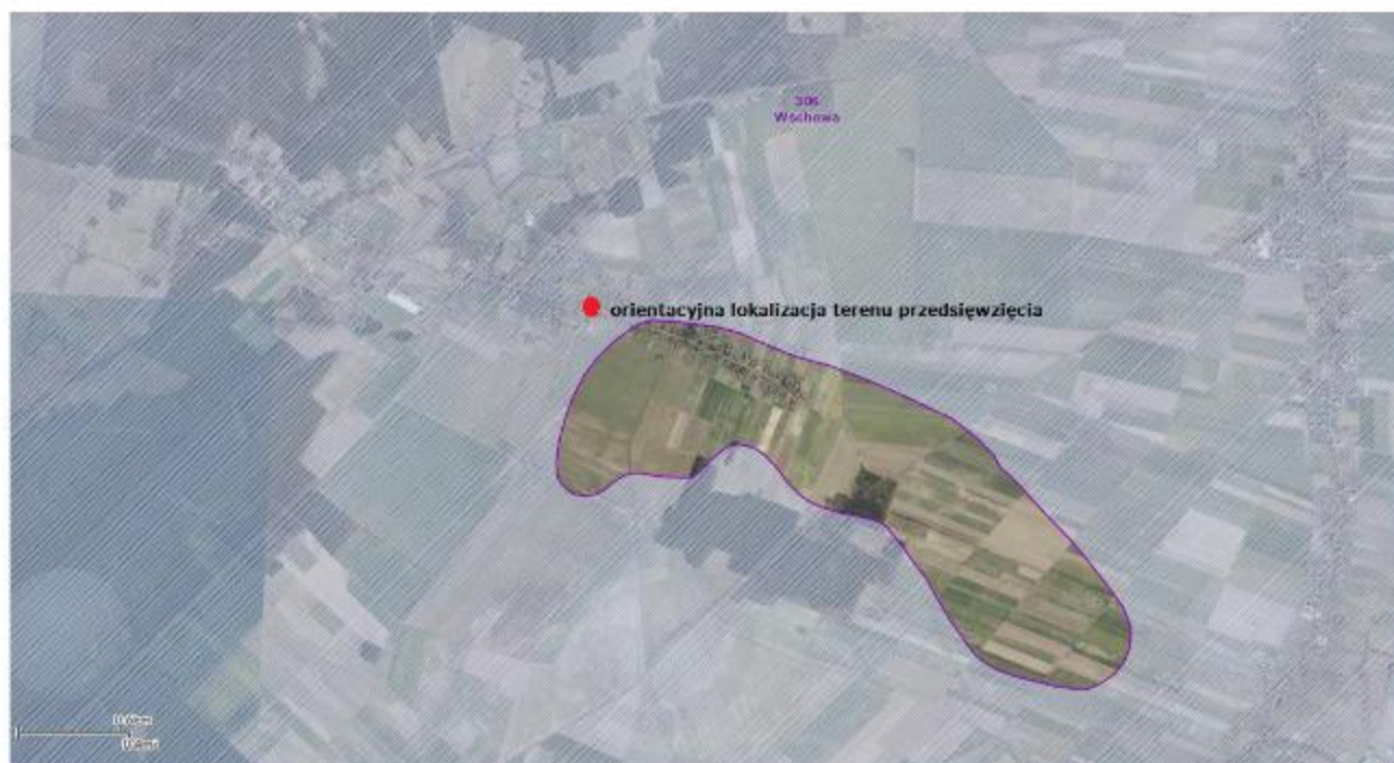
Rysunek 4 Lokalizacja terenu inwestycji na tle GZWP