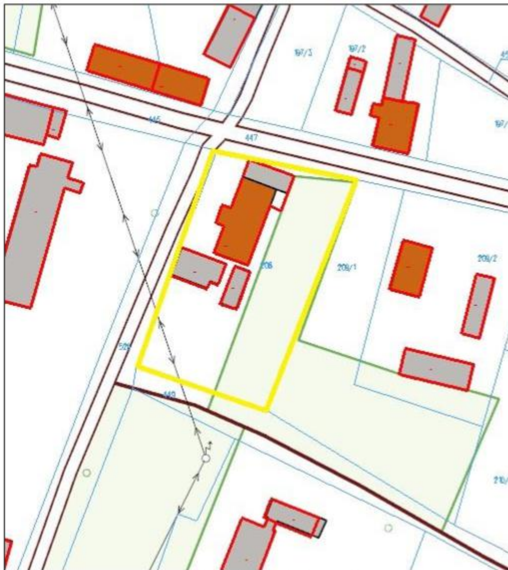
Rysunek 1 Lokalizacja inwestycji