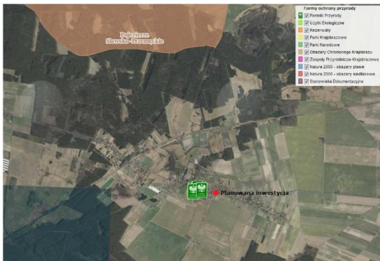
Rysunek 5 Lokalizacja inwestycji na tle obszarów chronionych