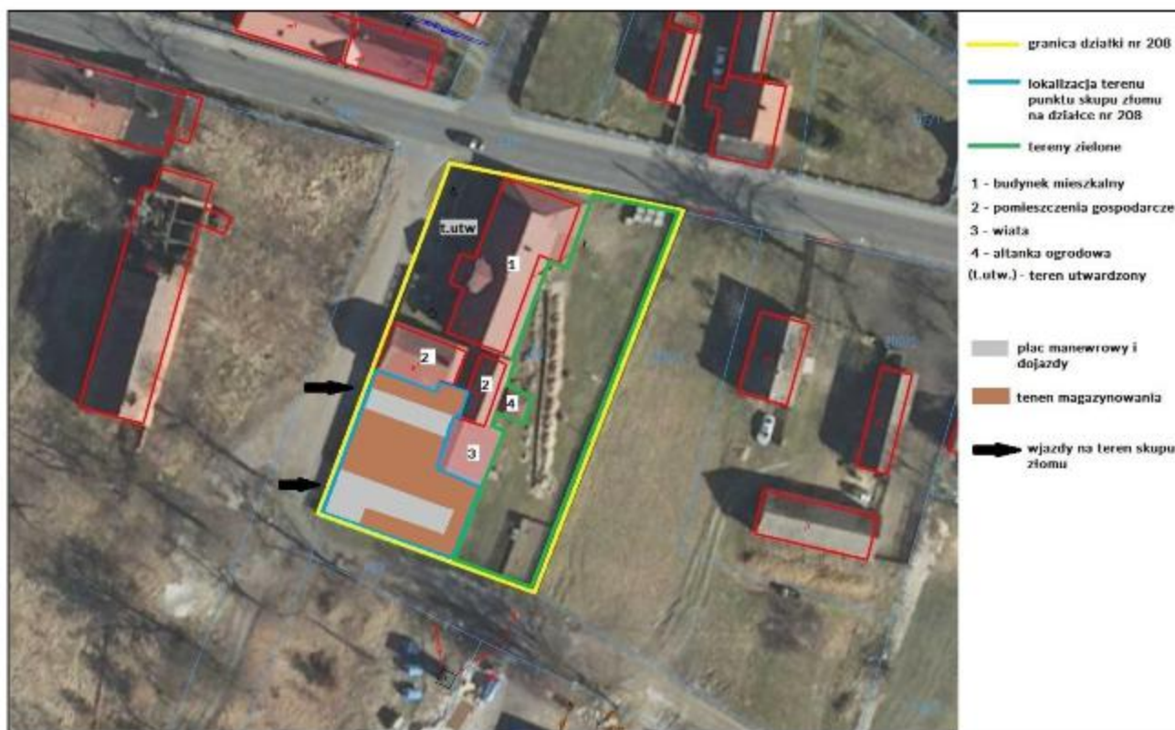
Rysunek 2 Zagospodarowanie działki nr 208 Stare Drzewce